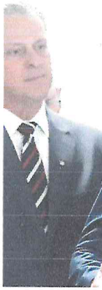
De acordo com o vice-presidente

O vice-presidente da República e ministro do Desenvolvimento, Indústria e Comércio (MDIC), Geraldo Alckmin, liderou nesta terça-feira (15) duas reuniões com empresários dos setores industrial e agropecuário. Ao lado de outros ministros e secretários, Alckmin recebeu informações sobre o panorama das áreas diante da decisão dos Estados Unidos de aumentar para 50% as tarifas de importação de produtos brasileiros. Os empresários manifestaram confiança nas negociações conduzidas pelo governo federal e defenderam que não sejam adotadas medidas de retaliação. A produção industrial e agropecuária já registram uma série de prejuízos.