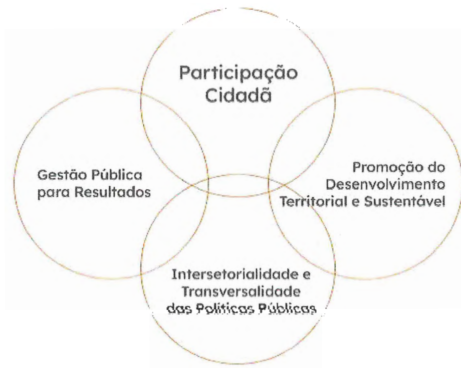
Figura 1 - Premissas do PPA 2026-2029